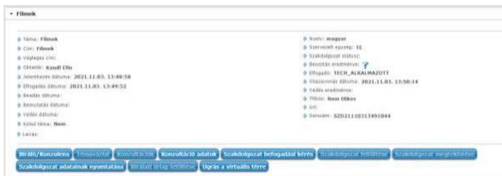
Elfogadott szakdolgozat sorok megtekintése hallgatói webes felületen

Amikor elfogadásra kerül egy szakdolgozat témajelentkezés sor (a témajelentkezés sorban a „Beosztás eredménye” jelölőnégyzet igaz értékre kerül beállításra), a beosztással létrejött szakdolgozat sor megtekinthető a „Tanulmányok/Szakdolgozat/Szakdolgozat jelentkezés” menüpontban. A felületen a szakdolgozat sor lenyitható, így érhető el a bővebb adatok. A lenyitható szakdolgozat sor fejléc sorában a szakdolgozat címe látható, az elnevezés előtt lévő kis nyílal lehet lenyitni az adott sort.